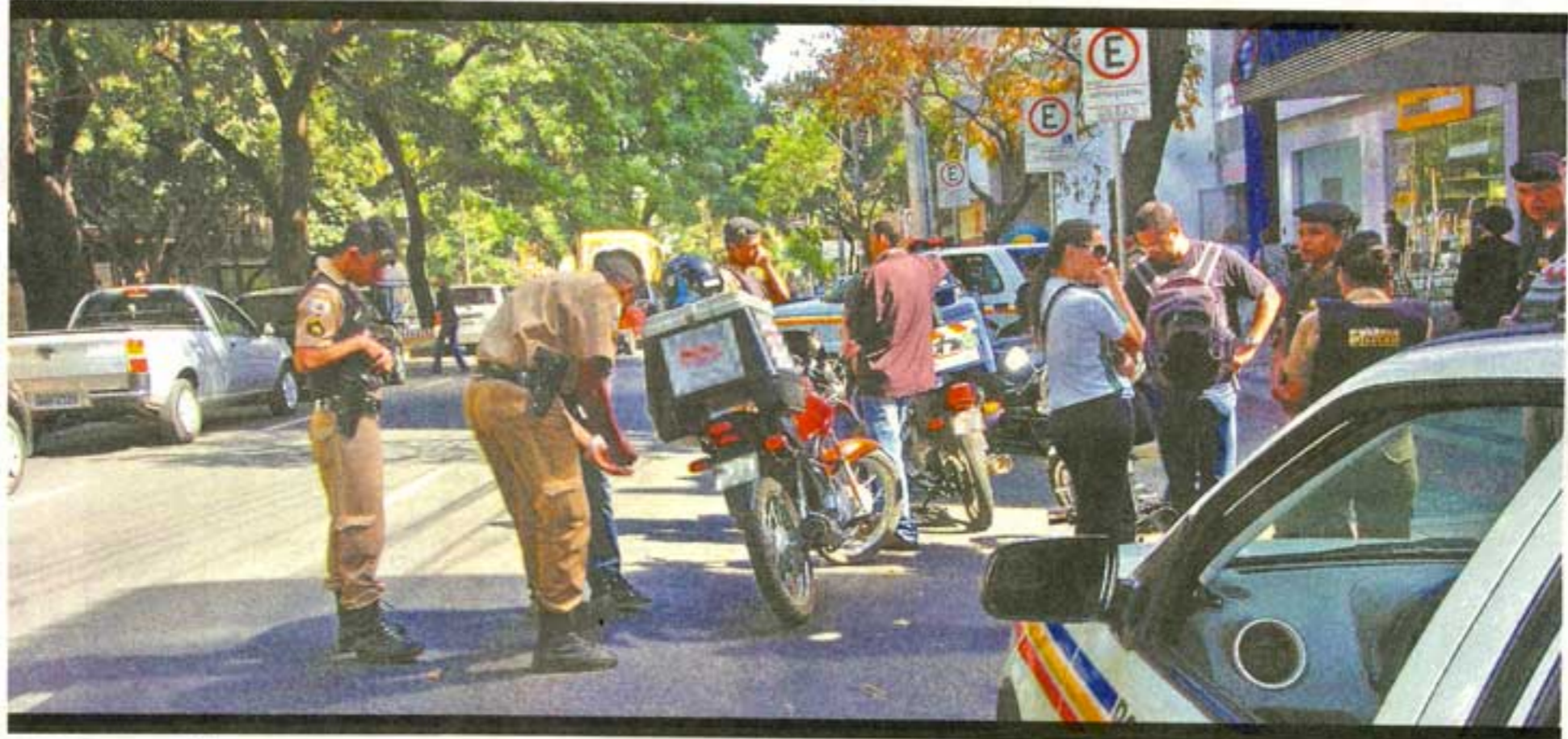
MOTOCICLISTAS SÃO ALVO CONSTANTE DE BLITZES DA PM, PORQUE ESTÃO ENVOLVIDOS EM 80% DOS ASSALTOS DO LADO DE FORA DAS AGÊNCIAS